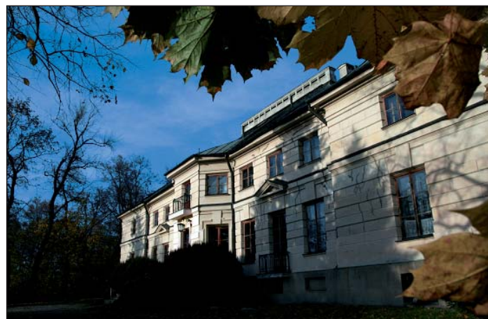
„Pałac w jesiennym słońcu” Marcina Michałowskiego