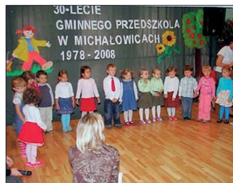
Występy grup 4 latków i 6 latków