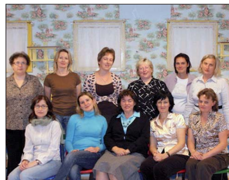
Kadra Pedagogiczna w roku 2008

Gminne przedszkole w Michałowicach liczy obecnie sześć oddziałów. Są to: oddział 3 latków, oddział 3-4 latków, oddział 4 latków, oddział 4-5 latków, oddział 5 latków i oddział 6 latków.