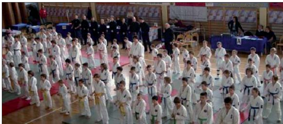
Uroczyste - oficjalne otwarcie mistrzostw karate. Z tyłu na czarno sędziowie