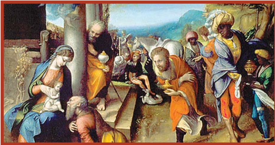
Antonio Allegri CORREGGIO 1489–1534 Adoracja trzech Króli 1517 - Galleria Nazionale, Parma

www.michalowice.pl • Egzemplarz bezpłatny • Nr 1/2009