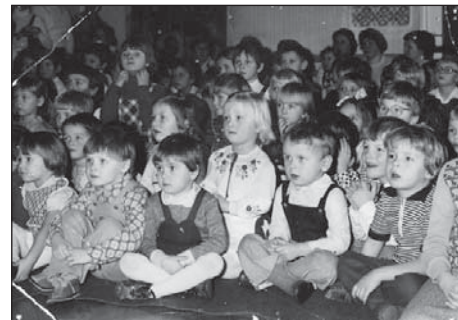
Wychowankowie przedszkola podczas przedstawienia, lata 80-te

Od stycznia 1990 r. stanowisko Dyrektora Gminnego Przedszkola w Michałowicach obję-