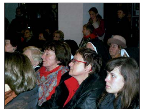
Publiczność w trakcie koncertu