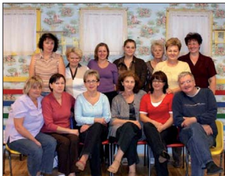
Kadra Administracyjna w roku 2008