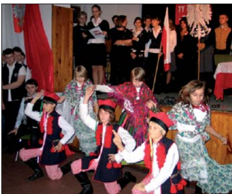
Program „Ty żyjesz Polsko” przygotowali uczniowie Zespołu Szkół w Nowej Wsi