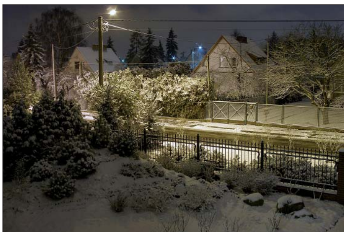
„Komorów nocą” Michała Podniesińskiego