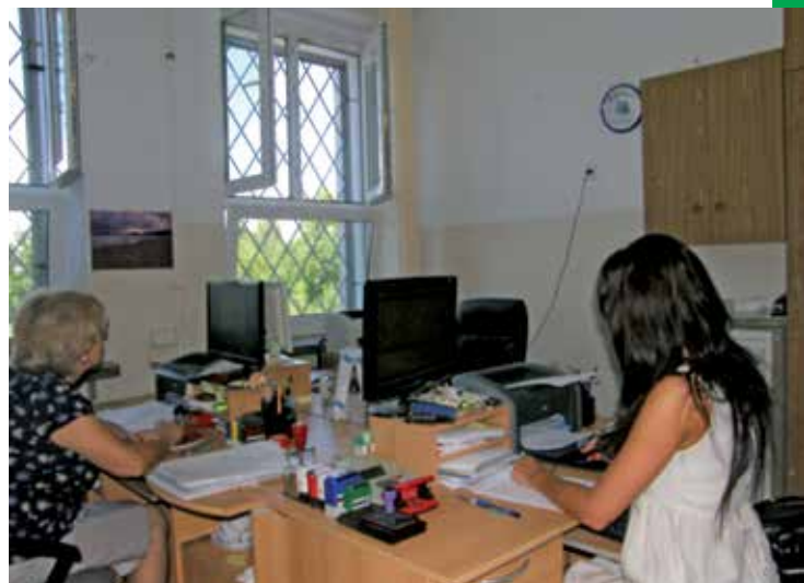
Siedziba ZOEAS-u – pomieszczenia w budynku szkoły w Nowej Wsi