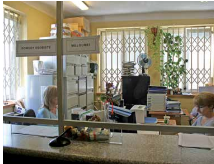
Siedziba przy ul. Raszyńskiej – pomieszczenia Referatu Spraw Obywatelskich