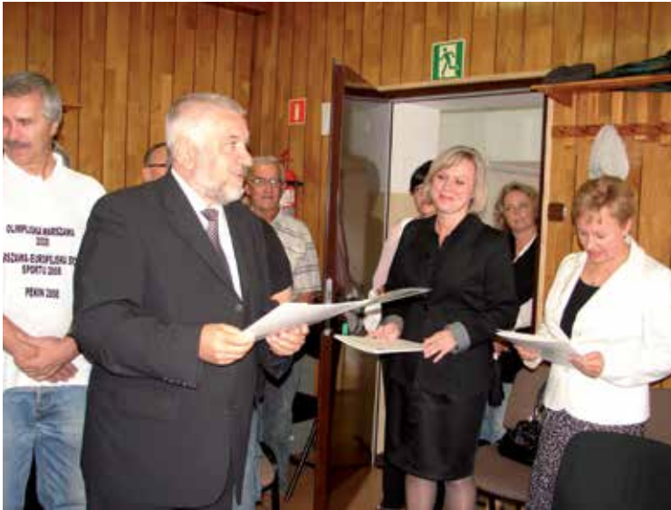
Siedziba przy ul. Raszyńskiej – sala, w której odbywały się sesje rady oraz gminne uroczystości

Budynek, w którym dotąd znajdował się Urząd Gminy Michałowice czeka modernizacja. Niebawem będzie on ponownie służył mieszkańcom Gminy. Najprawdopodobniej znajdzie tam swoje miejsce gminna Biblioteka.