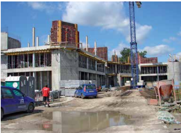
Czerwiec 2011 r. – zakończenie prac wznoszenia parteru i I piętra, rozpoczęcie wznoszenie II piętra