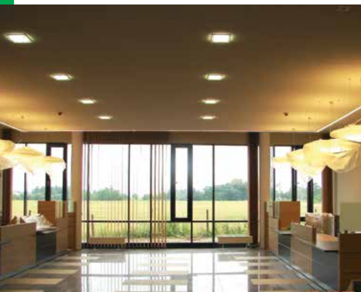
Lipiec 2012 r.