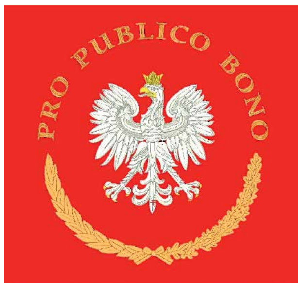
Pro Publico Bono – Dla Dobra Powszechnego