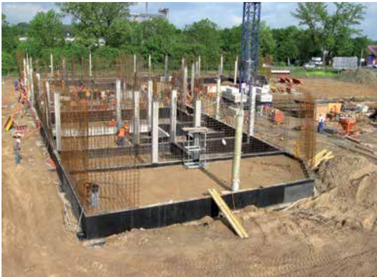
Maj 2011 r. – rozpoczęcie wznoszenia konstrukcji parteru