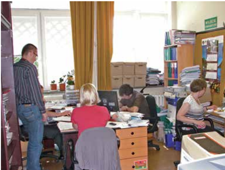
Siedziba przy ul. Raszyńskiej – pokój Referatu Gospodarki Komunalnej i Ochrony Środowiska