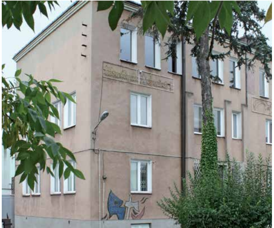
Budynek Urzędu przy ul. Raszyńskiej 34 w Michałowicach

Znaczne rozproszenie przestrzenne struktury Urzędu Gminy miało swoje negatywne skutki i rodziło wiele problemów. Występowały one m.in. w sferze koordynacji działań administracji, utrudniając w pełni efektywne zarządzanie sprawami Gminy. Zbyt mało miejsca uniemożliwiało dogodną obsługę interesantów, którzy niejednokrotnie wnioski wypełniali ad hoc. W głównej siedzibie Urzędu, przy ul. Raszyńskiej, na korytarzach można było spotkać stłoczonych interesantów, oczekujących na obsługę. Budynek nie był przystosowany do obsługi osób niepełnosprawnych. Wąskie, drewniane schody z trudem pozwalały na swobodne poruszanie się po Urzędzie. Sesje i posiedzenia komisji Rady Gminy oraz uroczystości gminne odbywały się w sali, w której często brakowało miejsca dla przybyłych na nie mieszkańców. Niewystarczająca liczba miejsc parkingowych to kolejny przykład niedogodności, z którymi przez wiele lat przychodziło borykać się interesantom.