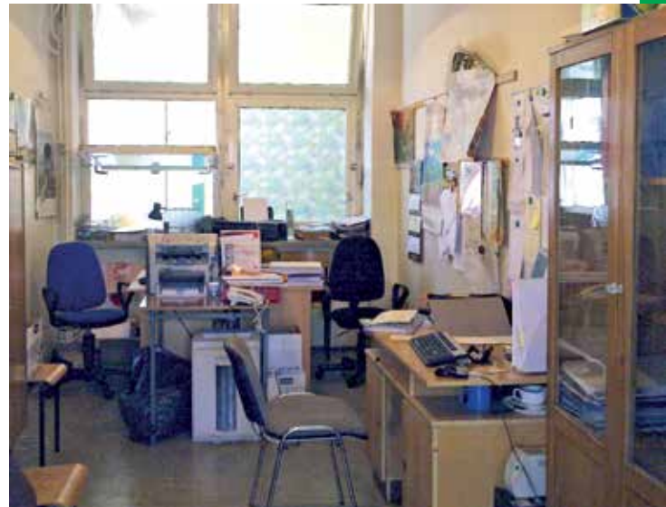
Siedziba Referatu Kultury i Spraw Społecznych mieszcząca się w szkole w Michałowicach