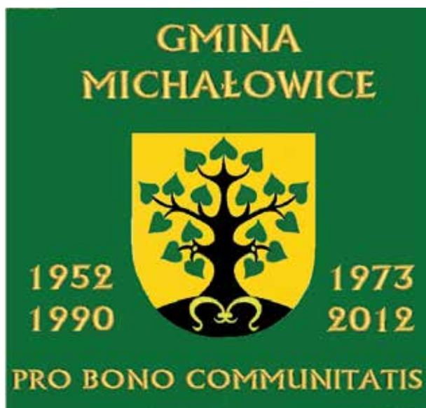
Pro Bono Communitatis – Dla Dobra Wspólnoty

Na drugiej stronie sztandaru umiejscowiono symbole odnoszące się do Państwa Polskiego. Na czerwonym tle widnieje wyszywany srebrzystymi nićmi orzeł w koronie. Od dołu okala go wieniec z liści laurowych i dębowych. Liście dębu symbolizują: siłę, męstwo i dzielność, zaś liście laurowe: zwycięstwo, chwałę, triumf, wieczność i mądrość. Nad wizerunkiem orła umieszczono ułożony w kształcie półkolistym napis Pro Publico Bono (Dla Dobra Powszechnego). Tym samym nawiązano do art. 1 Konstytucji RP, który stanowi „Rzeczypospolita Polska jest dobrem wspólnym wszystkich obywateli” czyli do zasady solidaryzmu społecznego.