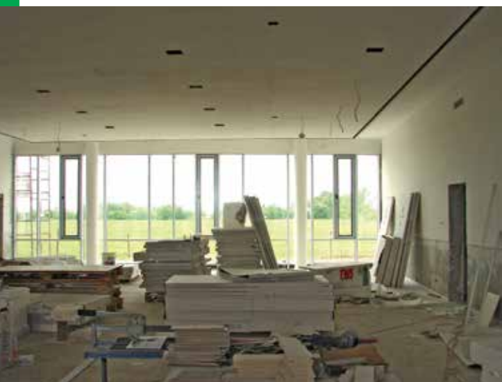
Kwiecień 2012 r.