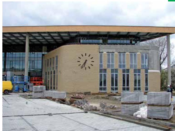
Kwiecień 2012 r. – prace wykończenia elewacji budynku oraz budowa parkingu przed Urzędem