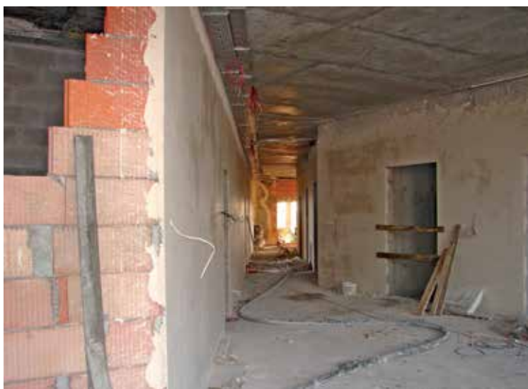
Styczeń 2012 r.