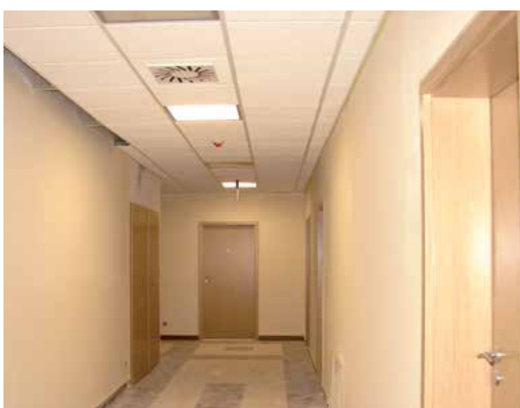
Lipiec 2012 r.