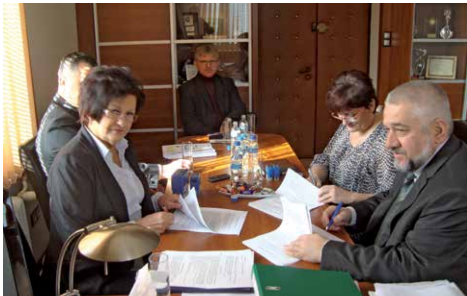
Podpisanie umowy - 15 lutego 2011 r.

Dzięki sprzyjającej pogodzie prace budowlane mogły trwać także zimą, na przełomie lat 2011-2012. W tym okresie zamontowano w nowym budynku okna, przystąpiono do tynkowania wnętrza.