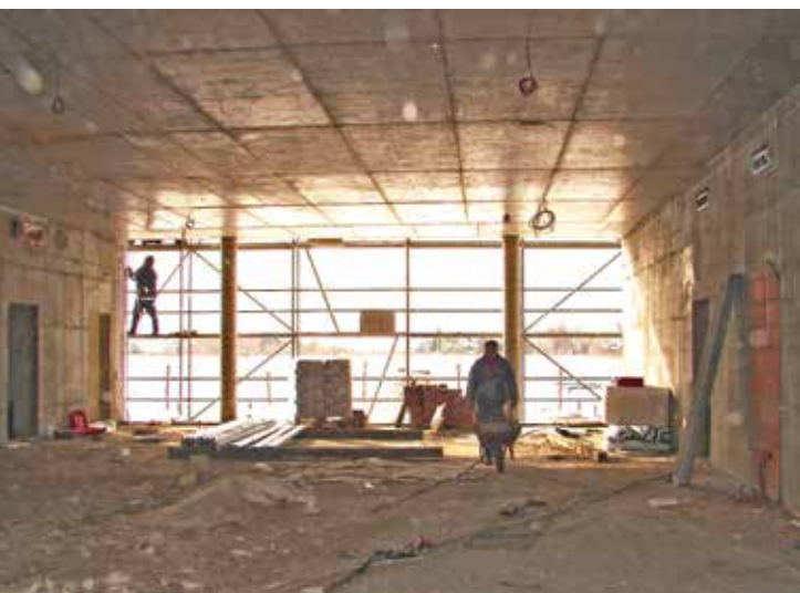
Luty 2012 r.