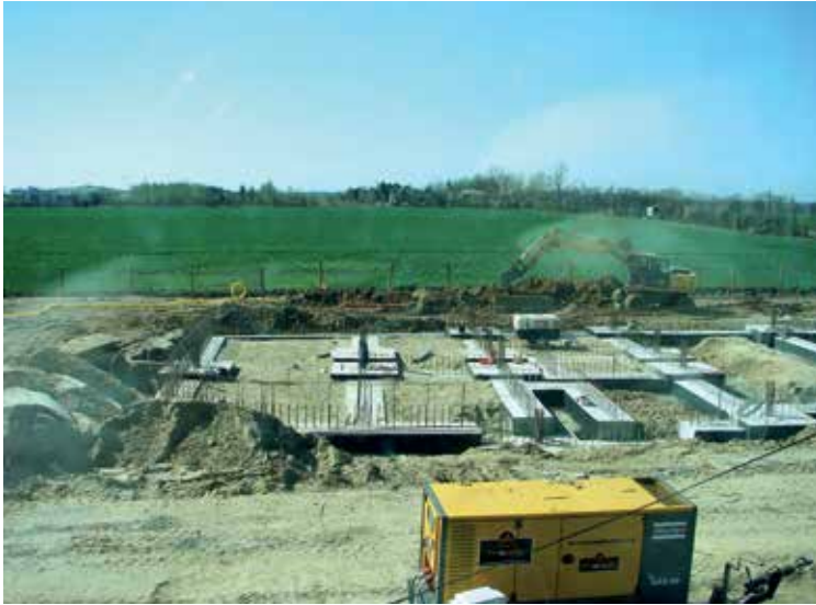
Kwiecień 2011 r. – zakończenie prac wznoszenia fundamentów budynku