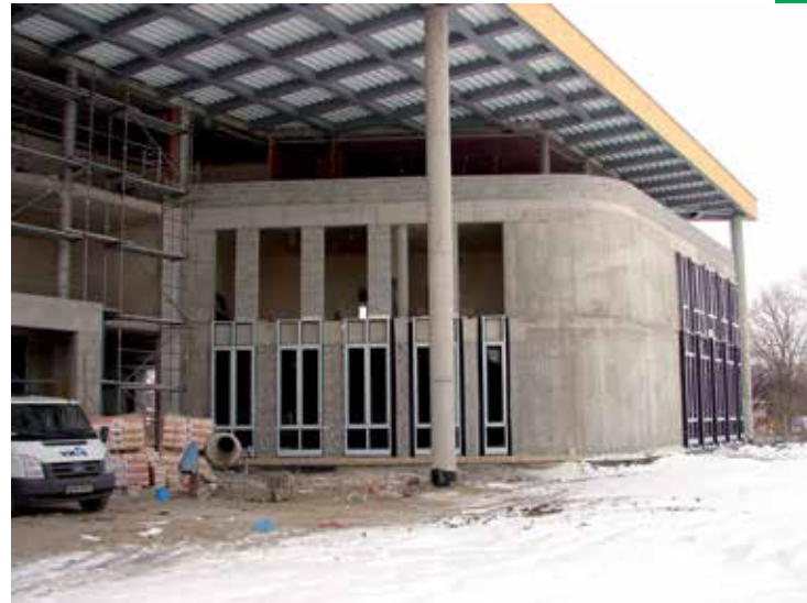
Luty 2012 r. – rozpoczęcie montażu ślusarki okiennej