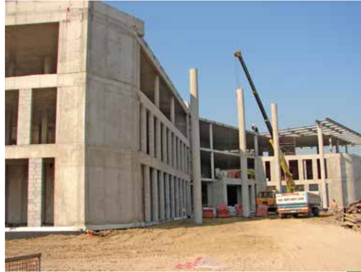
Wrzesień 2011 r. – zakończenie prac konstrukcyjnych budynku; rozpoczęcie montażu konstrukcji zadaszenia