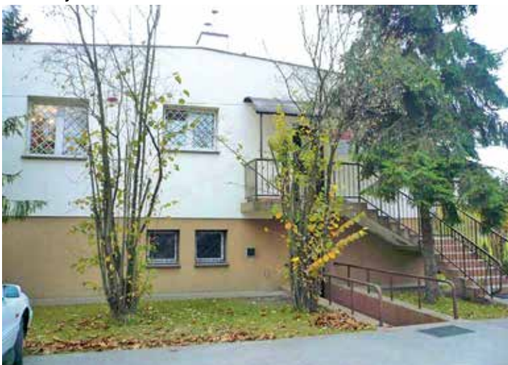
Siedziba GOPS-u zlokalizowana w budynku przedszkola w Nowej Wsi