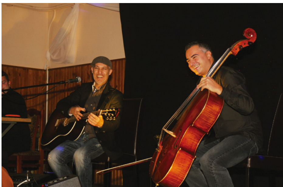
Zespół Flis Matell Duo