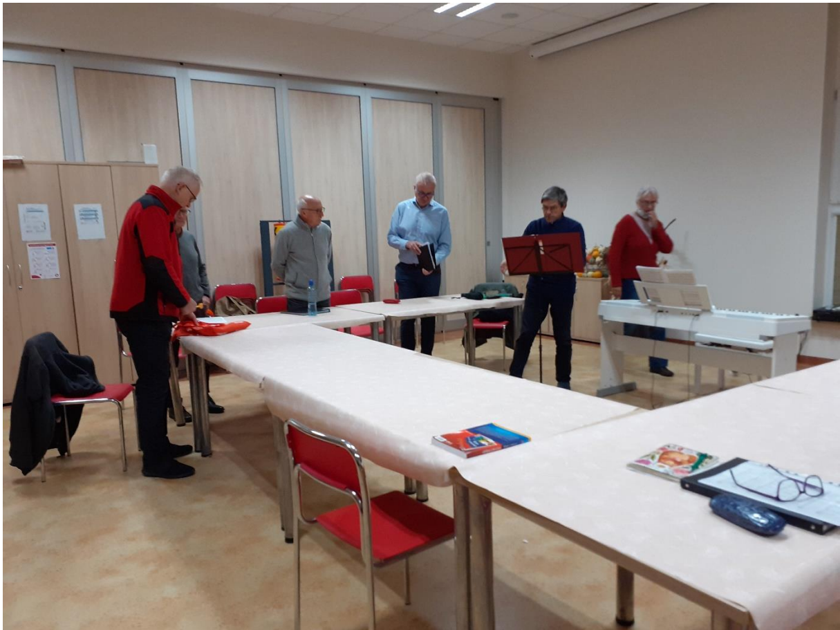
Próba chóru – ćwiczą basy

Na potrzeby chóru sporządzano kopie nut śpiewanych utworów, czasem w formie manuskryptu.