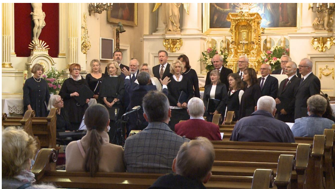
Występ chóru Komorowskiego Towarzystwa Śpiewaczego w Pęcicach dn. 11 X 2020 r.

Z których odbyły się tylko dwa pierwsze, pozostałe trzeba było odwołać.