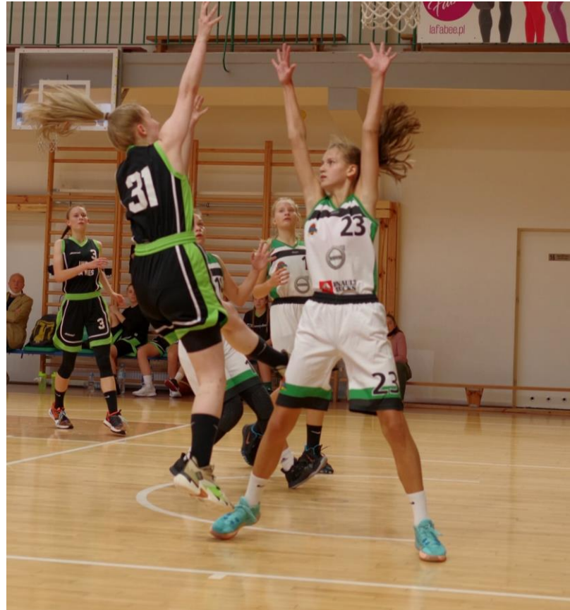
Uczestnictwo w rozgrywkach - mecze mistrzowskie i towarzyskie U17K i U19K