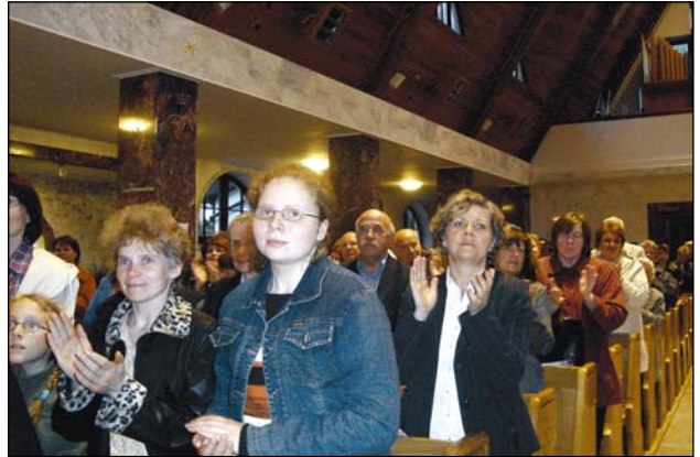
Publiczność dziękowała artystom na stojąco

– Usłyszeliśmy o życiu Jana Pawła II, o jego dążeniu do tego źródła, od którego ciągle się zaczyna; od tego źródła, do którego idzie się pod prąd – kontynuował ks. proboszcz. – Mistrz słowa Jerzy Zelnik powiedział, jak do tego źródła iść.