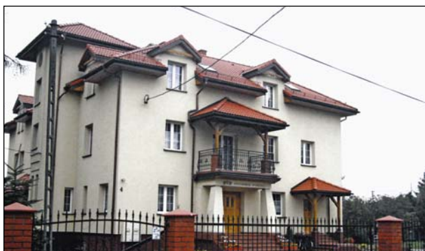
Nasz dom w Michałowicach