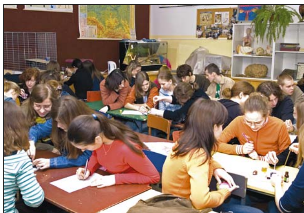
II Festiwal Nauk Przyrodniczych: wszyscy chętni mogli wykonać doświadczenia w pracowni biologicznej

Z końcem kwietnia, dokładnie w piątek 28 kwietnia, o godzinie 11.50 uroczystie pożegnaliśmy kolejny rocznik absolwentów kończących naukę w naszym Liceum. W tym