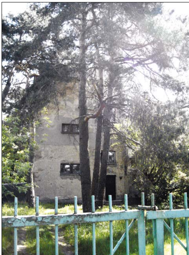
Willa inżyniera Tadeusza Apolinarego Wendy