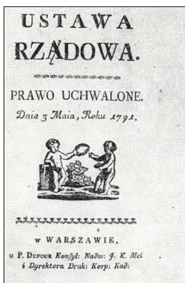
Karta tytułowa Konstytucji 3 Maja, wydanie Piotra Dufoura z 1791 r.