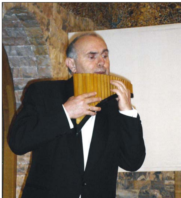
Fletnia Pana – rzadki instrument

Wszelką z ran świata wyrzuci zgniłość, Robactwo - gad, Zdrowie przyniesie - rozpali miłość I zbawi świat. Wnętrza kościołów on powymiata, Oczyści sień, Boga pokaże w twórczości świata, Jasno jak dzień.